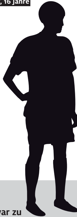
Roccy, 16 Jahre